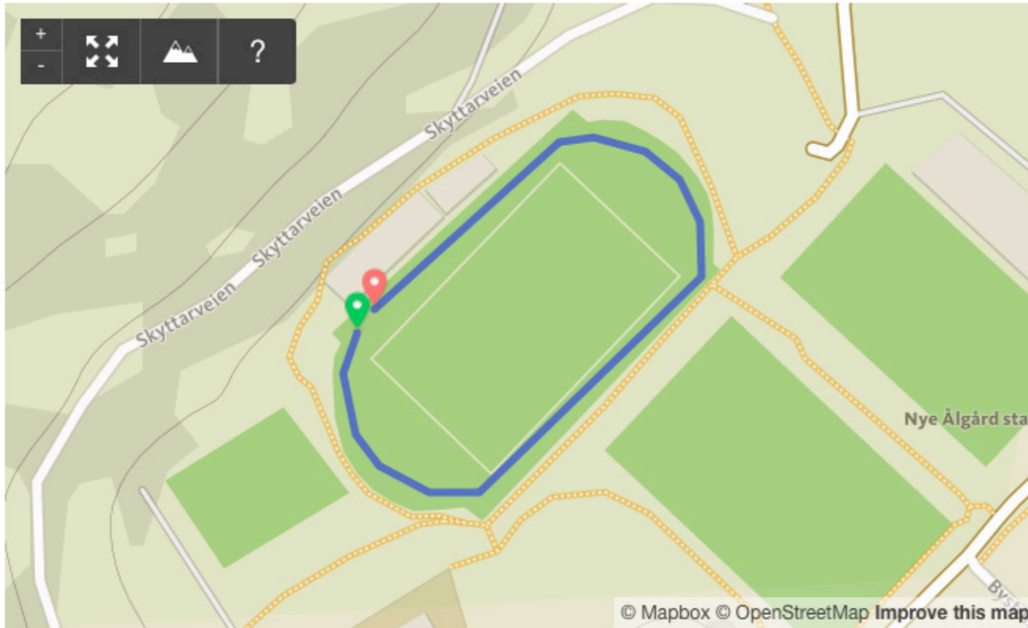
Etappe 1: 400 meter på bane