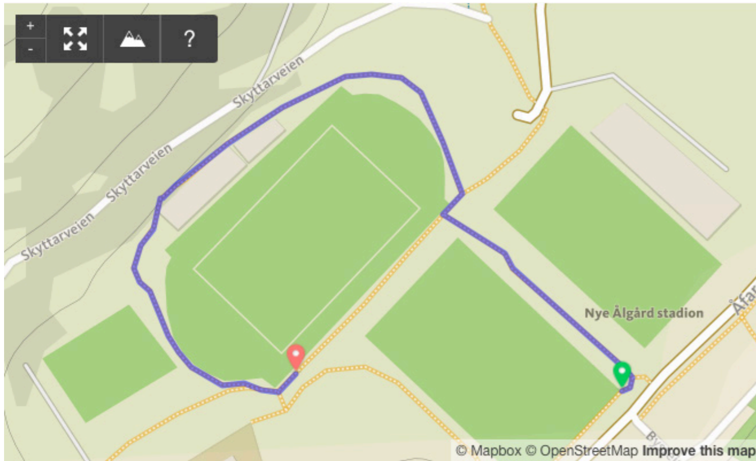
Etappe 3: 550 meter (fra treningsbanen og rundt klubbhuset til GIL)