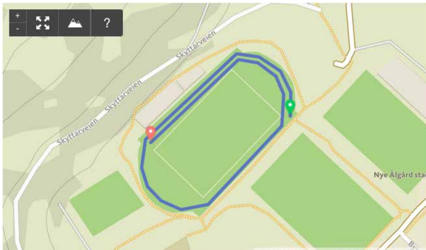
Etappe 1: 600 meter på bane