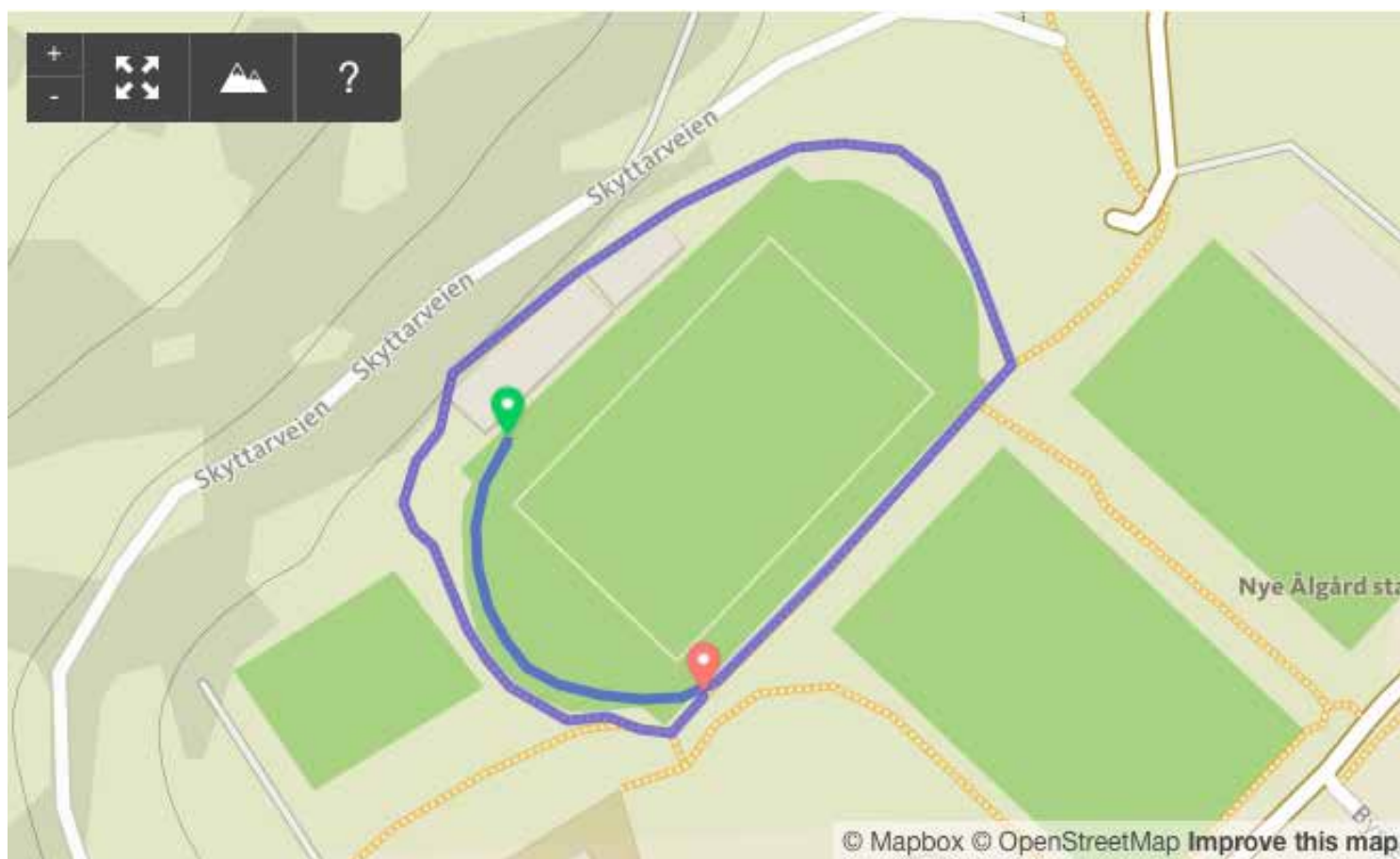
Etappe 3: 650 meter (100 på bane, rundt klubbhuset)