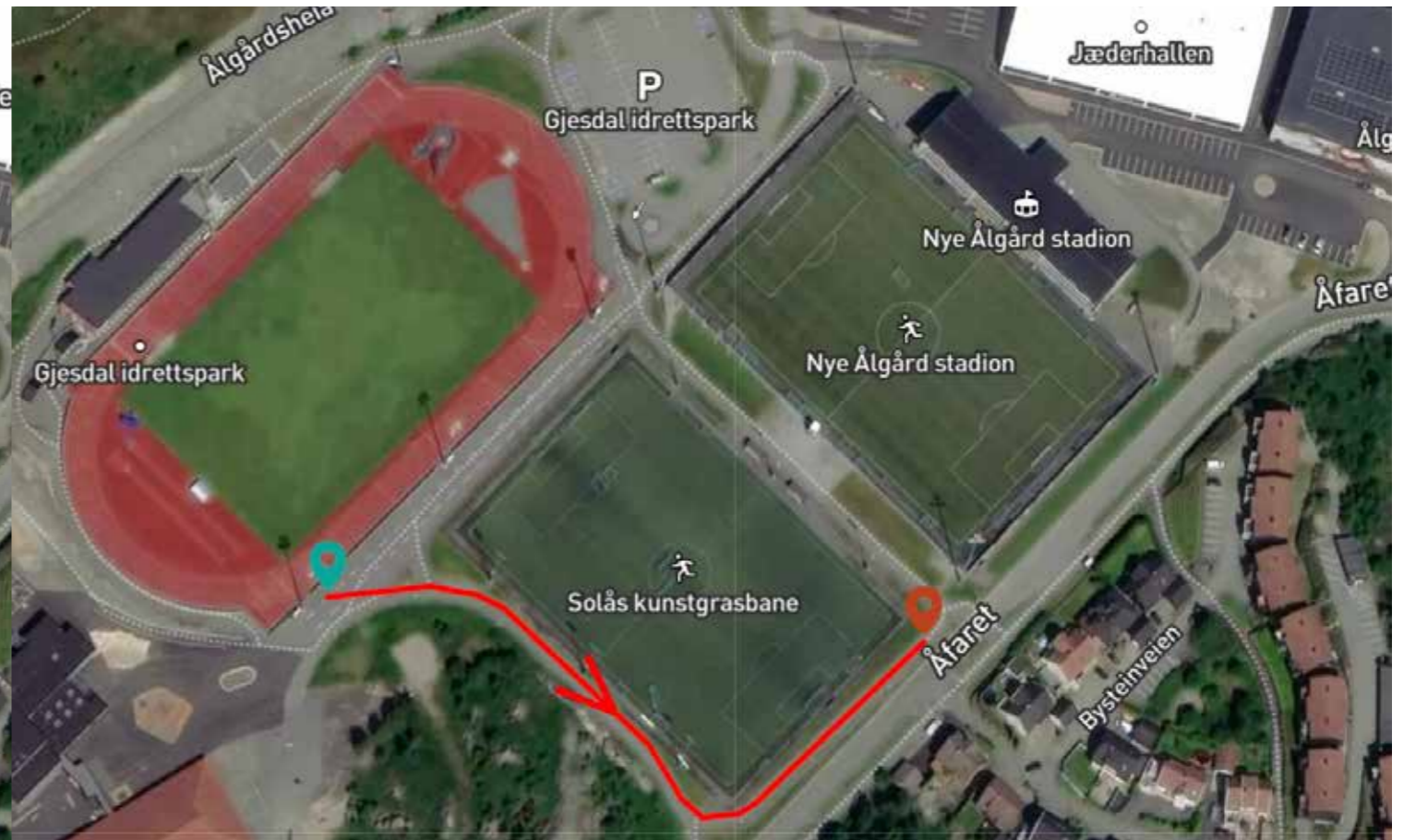
Etappe 2: 220 meter (halvveis rundt treningsbanen)