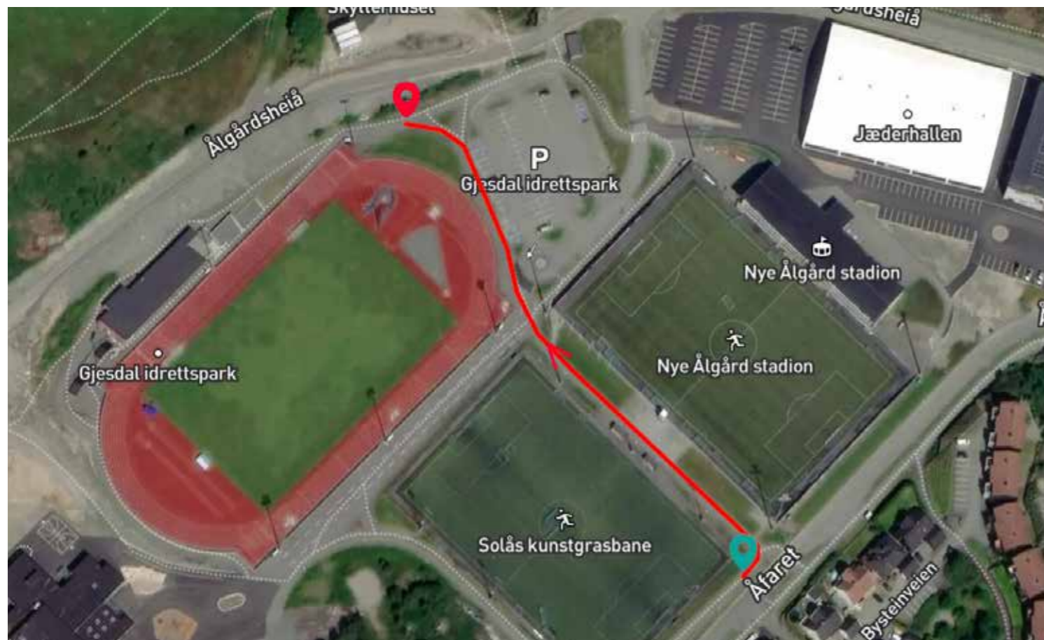
Etappe 3: 250 meter (Fra treningsfelt til utsiden av 100 m start)